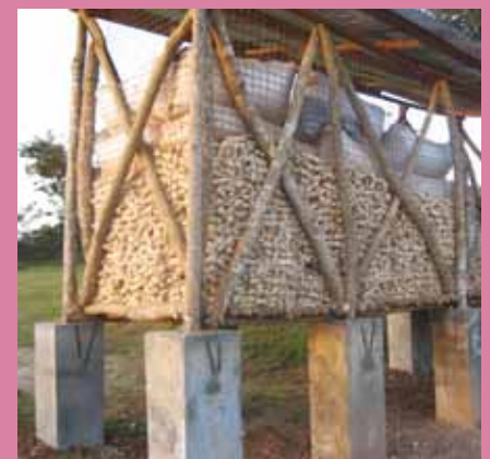
Oude vorm van voedselopslag in de epicentra