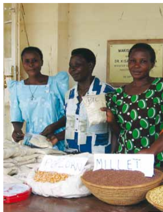
Een rijke oogst