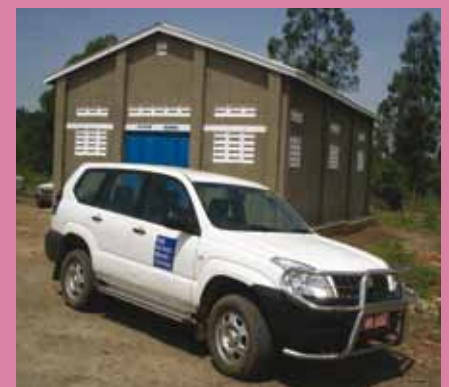
Nieuwe vorm van voedselopslag in de epicentra