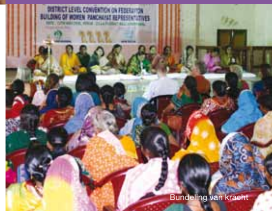
Bundeling van kracht

2 Benin-bezoek: de verrassende blik van nieuwe vrienden 3 Resultaten en ambities | Barrometer | Bedrijvennis | Wij vragen 4 8 maart, Internationale Vrouwendag | Kantoorennis | Agenda