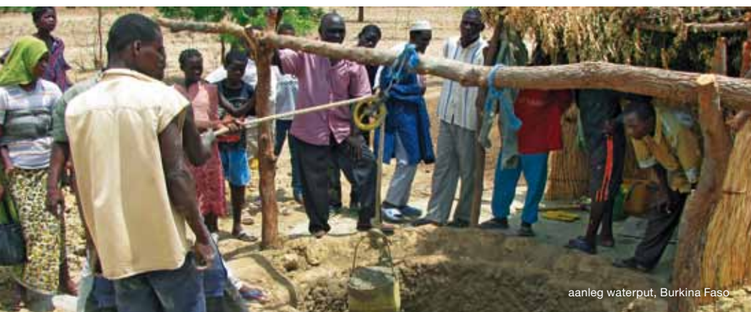
aanleg waterput, Burkina Faso