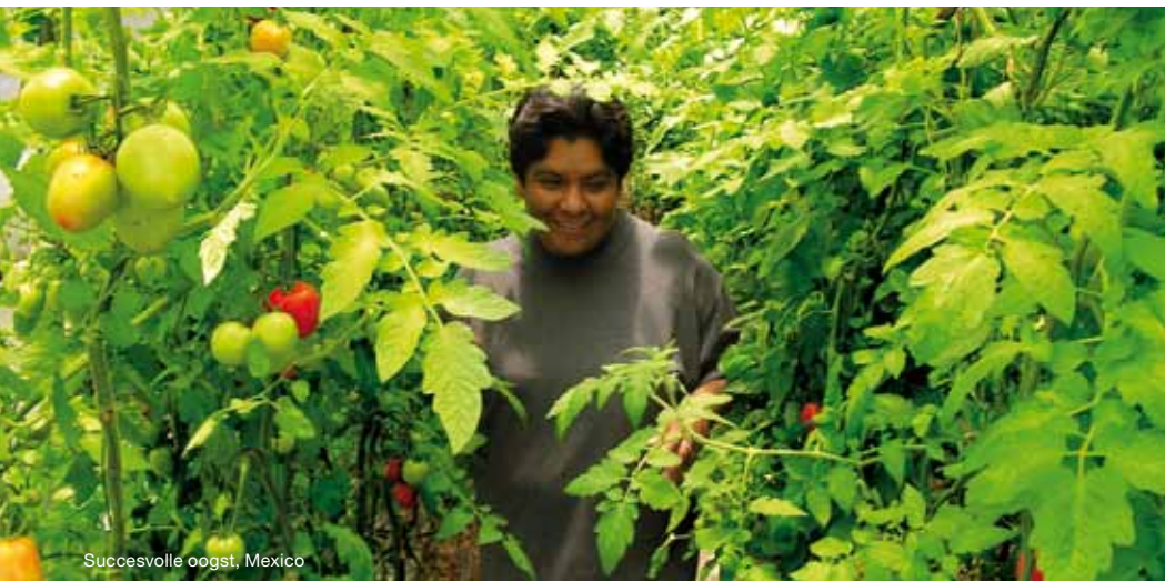
Succesvolle oogst, Mexico

Tijdens een evaluatiebijeenkomst op 12 november met leden van het bestuur en het kantoor legden Ideas for Brands inspirerende bevindingen voor. Het bestuur bespreekt dit in detail op een vergadering van 17 december. Tipje van de sluier: er is veel dat ons bindt! Het zit in ons en we doen het samen! Een kleurrijke, energieke en ondernemende organisatie die zich onderscheidt door een methode die werkt. Ook de uitingen van het merk roepen om invulling daarvan. Kortom: werk aan de winkel in 2010! Lees meer in een uitgebreid artikel in de volgende nieuwsbrief.