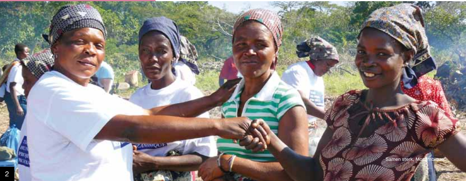
Samen sterk, Mozambique

'The Hunger Project heeft een unieke positie in de sector. Juist de ondernemersgeest die leeft bij de investeerders en vrijwilligers van The Hunger Project is bijzonder. Ik zie een professionele organisatie waar duidelijk is waaraan gewerkt wordt, met besluitvaardige en heel betrokken mensen. Er zijn maar weinig ontwikkelingsorganisaties die zo'n groot relatienetwerk hebben met het midden- en klein bedrijf in Nederland. Juist het inzetten op investeerders, anders dan organisaties die vooral op subsidie van de overheid steunen, geeft The Hunger Project een heel andere dynamiek. Daarin hebben we een eigen verhaal dat gebruikt kan worden voor het verder uitbouwen.'