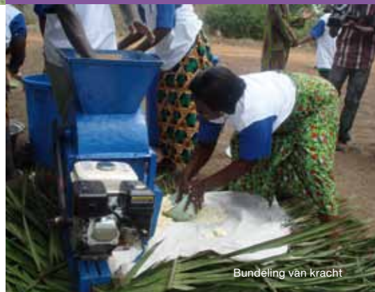
Bundeling van kracht

In het eerste kwartaal van 2010 zijn er 257 leningen verstrekt via het microkredietprogramma van THP, met een totaalwaarde van $29.942,-. Het merendeel (95%) van de leningen wordt op tijd terug betaald. Om het risico op onbetaalde leningen te verkleinen, is in 2009 op jaarbasis 2% extra rente toegevoegd aan de bestaande rente van 20% op alle microkredieten. Dit bedrag wordt door het Microkrediet Comité gebruikt om verliezen, afkomstig uit onbetaalde leningen door sterfte en permanente invaliditeit, af te dekken. De banken in de epicentra bieden mensen ook de mogelijkheid om een spaarrekening te openen. In totaal werd er in het eerste kwartaal van 2010 bij deze banken $ 2.249,- gespaard.